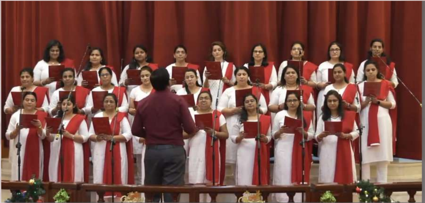
Sevika Sangham Choir