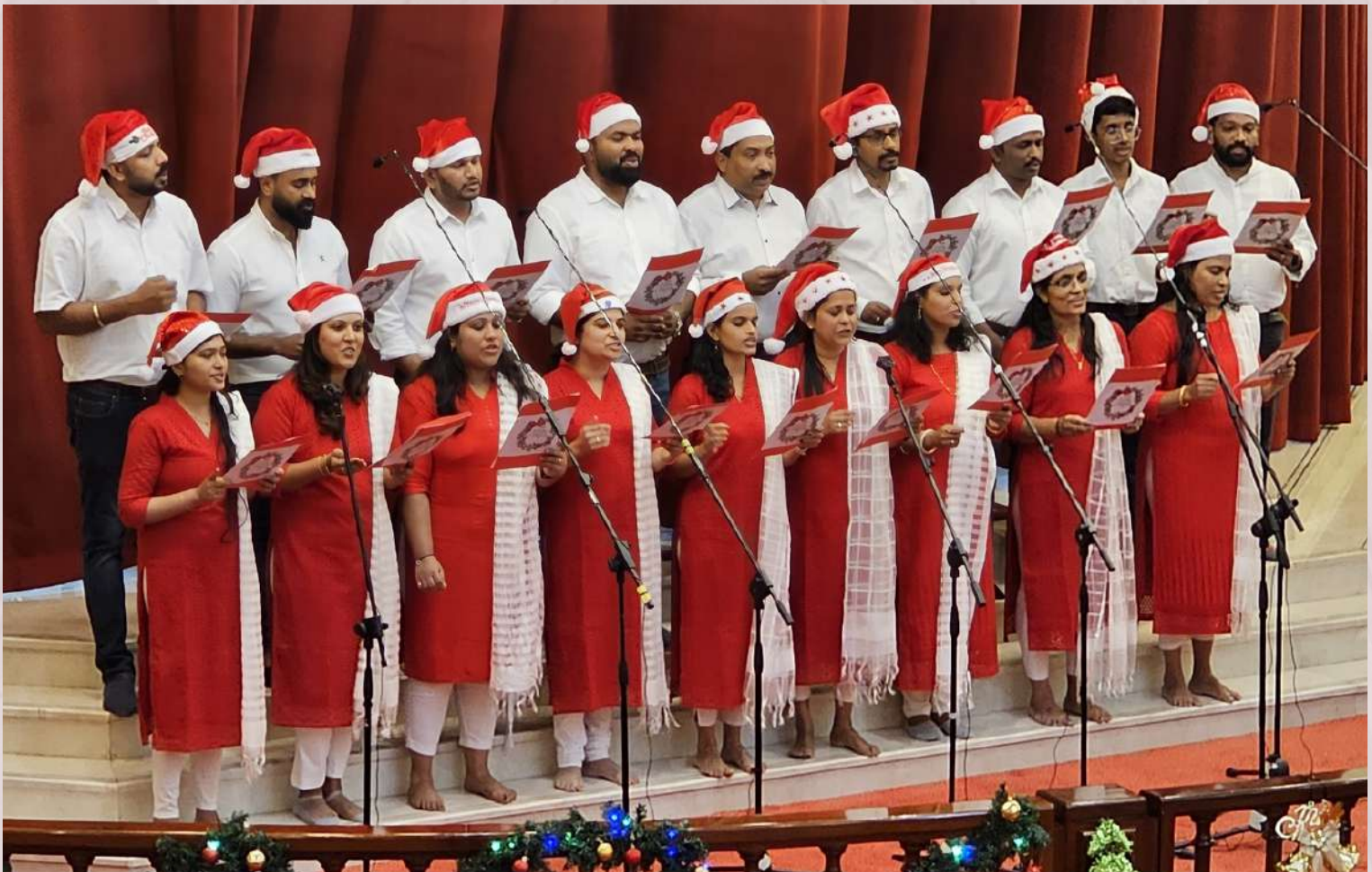
Yuvajana Sakhyam Choir