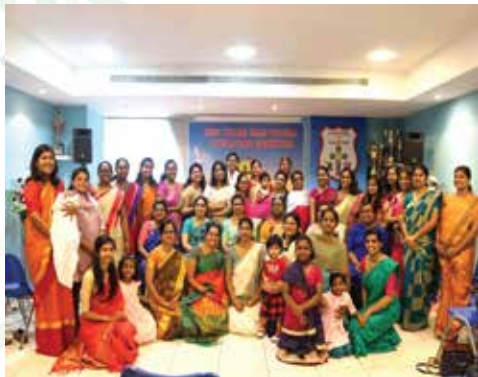
ADMTYS - Women's Day Celebration