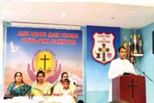
ADMTYS -Women's Day Celebration