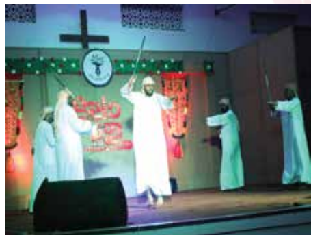
Mar Thoma Yuvajana Sakhyam Kendra Kalamela - Arabic Dance by ADMTYS Team