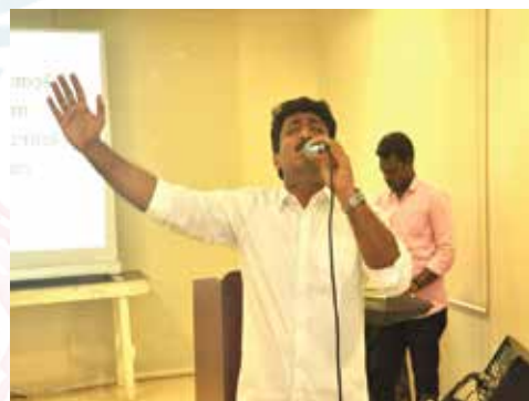
Parish Mission Praise & Worship