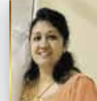
DEEPA VARGHESE JOINT SECRETARY